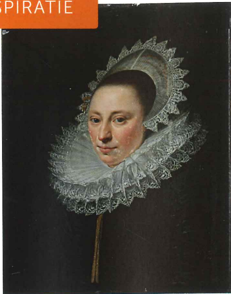
Een van de inspiratiebronnen, statieportret van een onbekende schilder